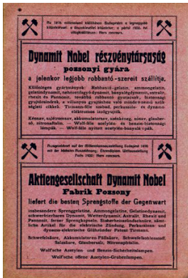
3 Plagát dcárskej továrne založenej Alfredom Nobelom (Bratislavská továreň vyrábala chemikálie a výbušniny)