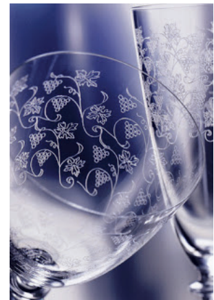
5 Nápojová súprava, brúsené sklo (v roku 1896 bol na Slovensku uvedený do prevádzky stroj na pantografické dekorovanie skla, ktorý bol prvý na európskom kontinente)