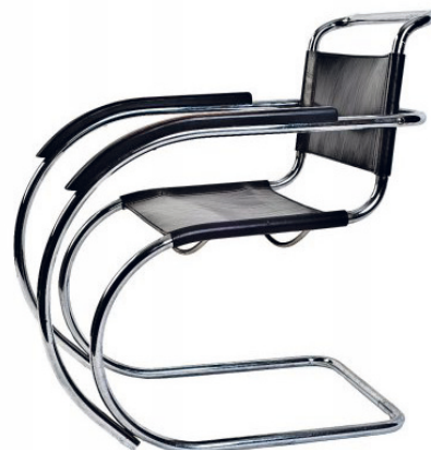
6 Kreslo. Návrh: Ludwig Mies Van Der Rohe, realizácia: Berliner Metallgewerbe Josef Mülle. Poniklovaná oceľ, železné vlákna. Návrh: 1926 – 1927, produkcia: 1927 – 1930