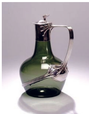
1 Karafa. Návrh: Charles R. Ashbee, realizácia: James Powell & Sons of Whitefriars. Fúkané sklo, tepaná strieborná rúčka. Veľká Británia, 1904