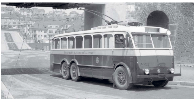
4 Prototyp trolejbusu 1 Tr. Návrh a realizácia: Škodove závody. Praha, 1936