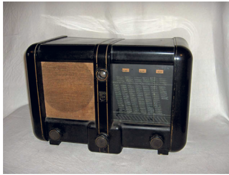
1 Rádio značky Turngram (po 1945 Tesla)