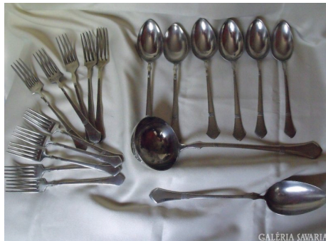
4 Príbor z alpaky („nemecké“ alebo „nové“ striebro je zliatina medi, niklu, zinku)